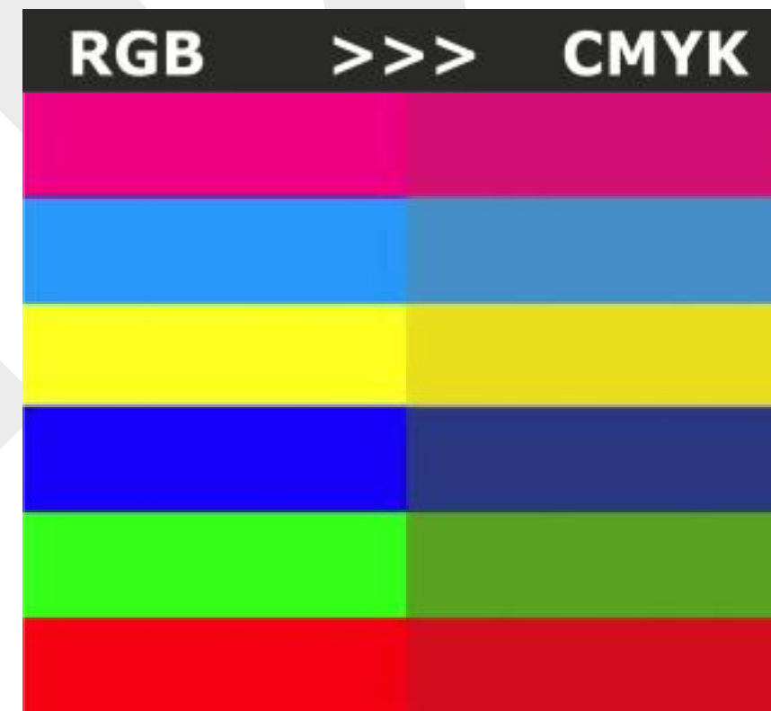
Utrata jakości przy zamianie palety RGB na paletę CMYK

W przypadku użycia kolorów z palety RGB (zarówno w druku cyfrowym jak i offsetowym) zostaną one zamienione na kolory z palety CMYK, co wiąże się z pogorszeniem jakości. Kolory PANTONE (przy druku cyfrowym) zostaną zamienione na najbliższy kolor z palety CMYK.